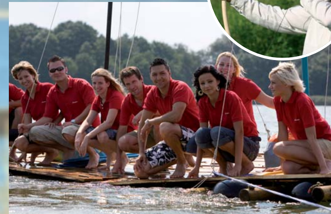
Outdoor-Rahmenprogramme „direkt vor der Haustür“ Outdoor theme programmes directly right on your doorstep