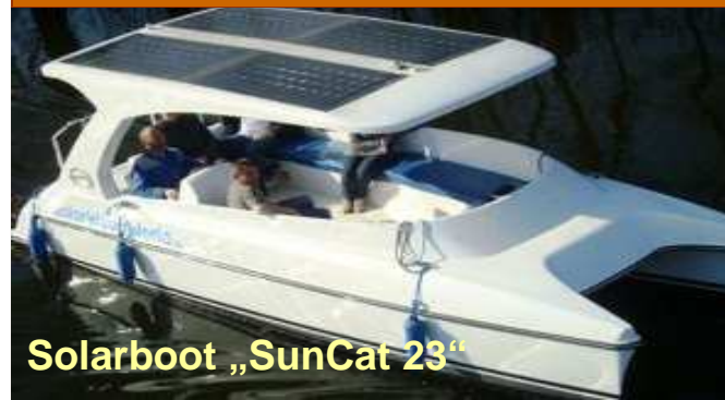
Solarboot „SunCat 23“